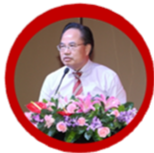
健康垂直媒体代表