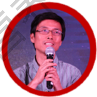
全国平面媒体代表