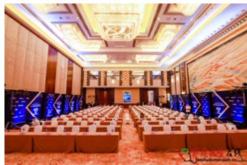
场内企业形象展架示意图（蓝色）