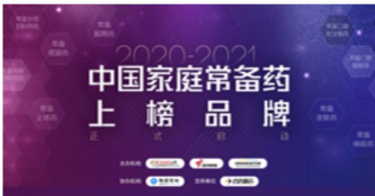
健康行业权威评选