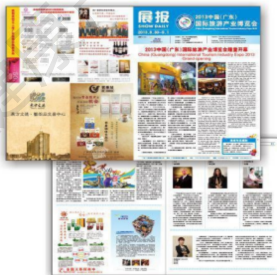
展报 (图为 广告 1/4 版)